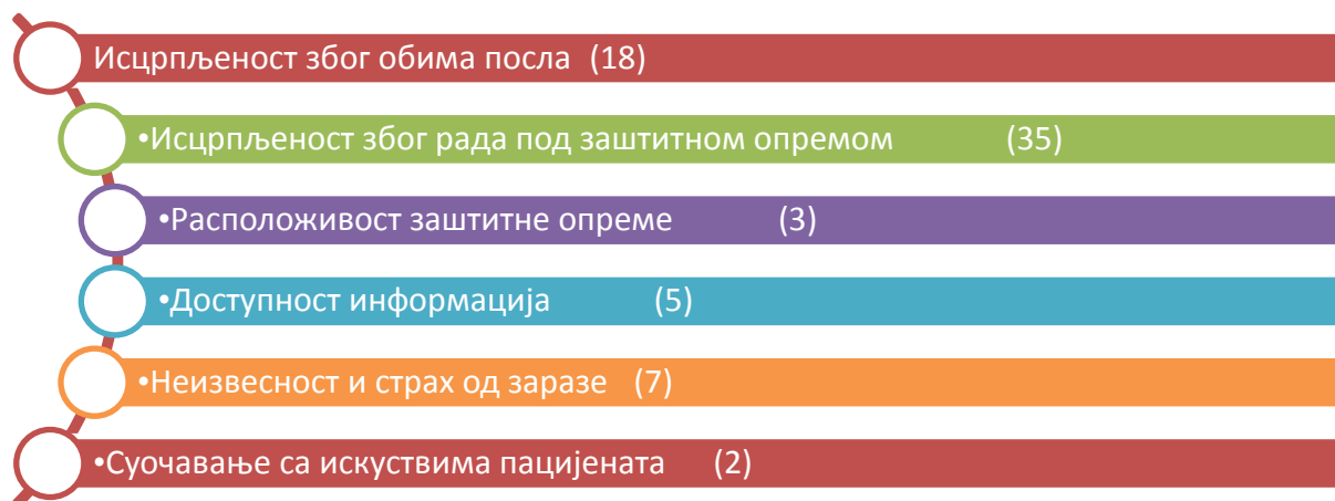
Схема 3. Изазови рада у току актуелне пандемије корона вируса, представљени од највећег до најмањег, 2022. година

На питање које се односило на размишљање о промени посла у наредних пет година, запослени у највећој мери не размишљају о промени посла, њих 90(63,38%), 23 (16,20%) запослених би желело да ради послове ван здравствене заштите, њих 14 (9,86%) размишља о одласку у иностранство, графикон 5.