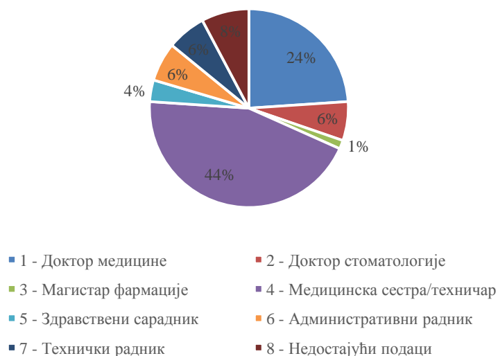
Графикон 1. Структура испитаника према занимању, Завод за здравствену заштиту студената Београд, 2022. година

Слично као и у претходној години, у 2022. год. на руководећој функцији налазило се 19 (13,38%) запослених испитаника, док њих 116 (81,69%) није обављало ниједну руководећу функцију (графикон 2).