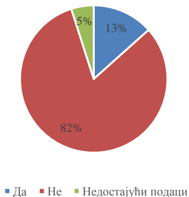
Графикон 2. Учешће руководећег кадра у укупном броју запослених који су учествовали у истраживању, 2022. година

Слично као и у претходној години, у 2022. год. на руководећој функцији налазило се 19 (13,38%) запослених испитаника, док њих 116 (81,69%) није обављало ниједну руководећу функцију (графикон 2).